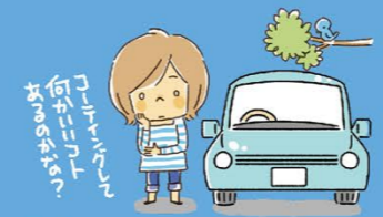
アイコさん(31歳・主婦) 車種:軽自動車 乗車歴:3ヶ月 洗車:たま〜に自分で洗車 性格:スポラ、のーんき

左のハガキのアンケートにお答えいただき応募ください。 ※観戦チケット・グッズの当選者は発送をもってお知らせ致します。