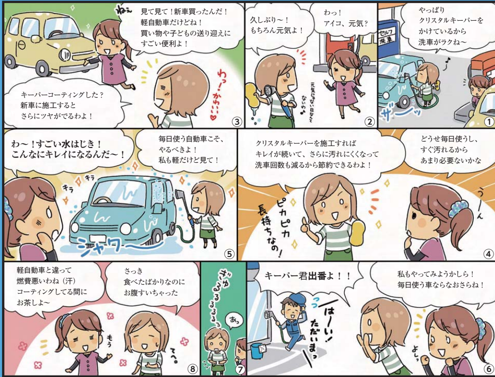
クリスタルキーパーをすると、汚れにくくなって洗車回数が減ります。汚れたら水洗いするだけでOK！ 新車のうちに施工すれば、さらにキレイが続いて愛車を守ります！ 毎日使う車にこそおすすめですよ！

近所に買い物にでかけたり、子どもの送り迎えに使うだけ。軽自動車にもコーティングって必要のかな？